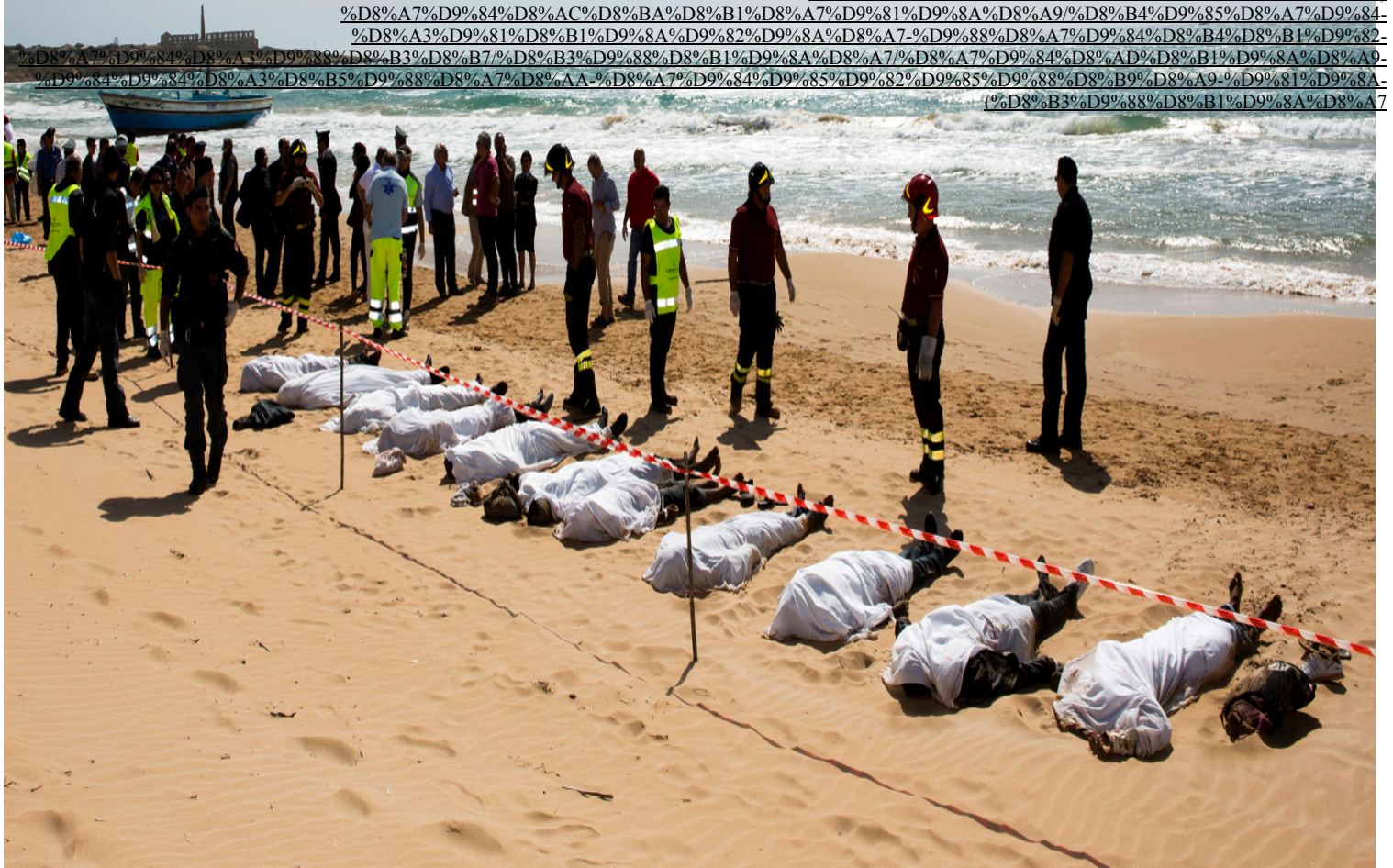
اللقطيم الثمين 10 يوليو 178