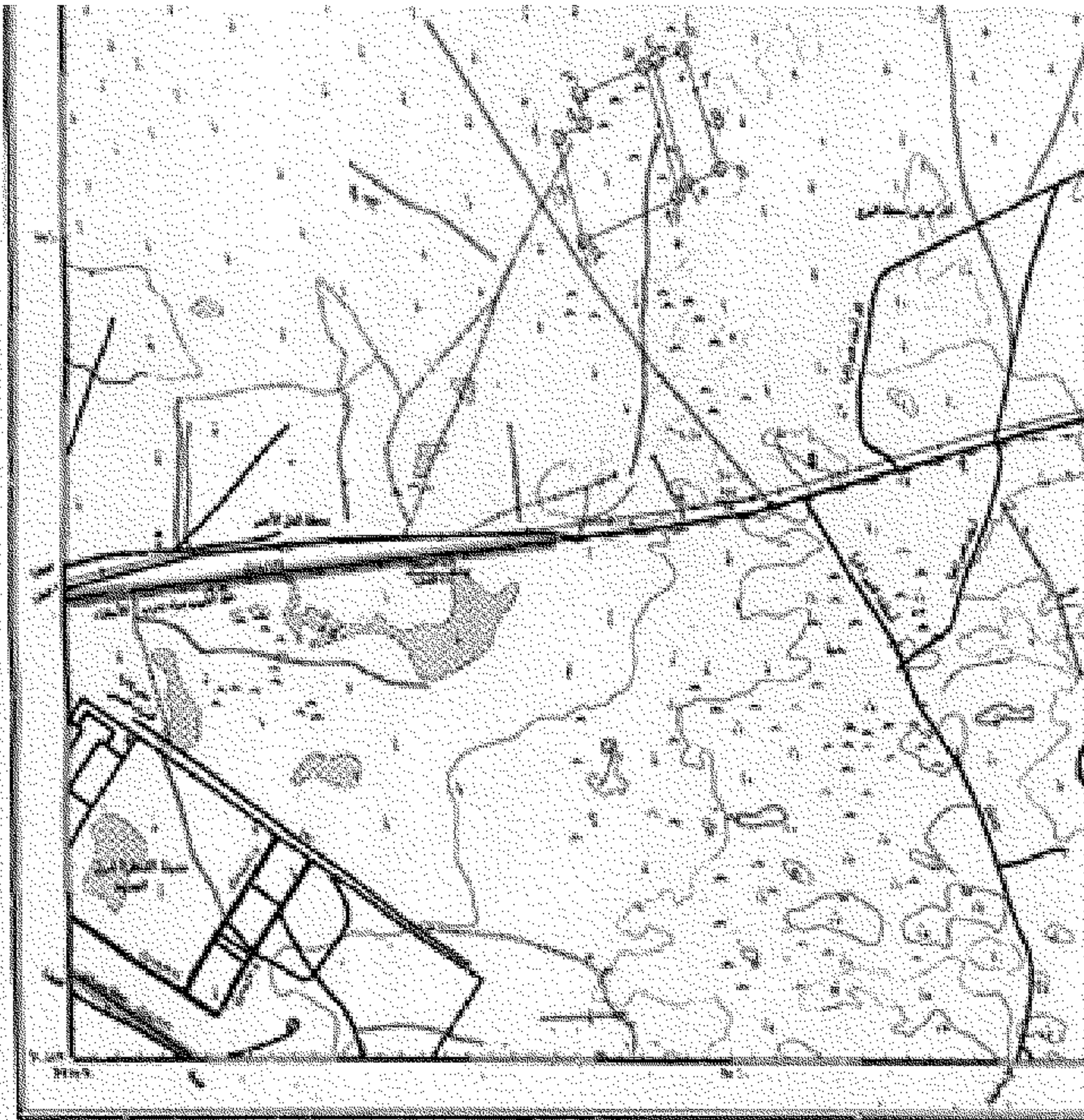
الخطة العامة للمشروع