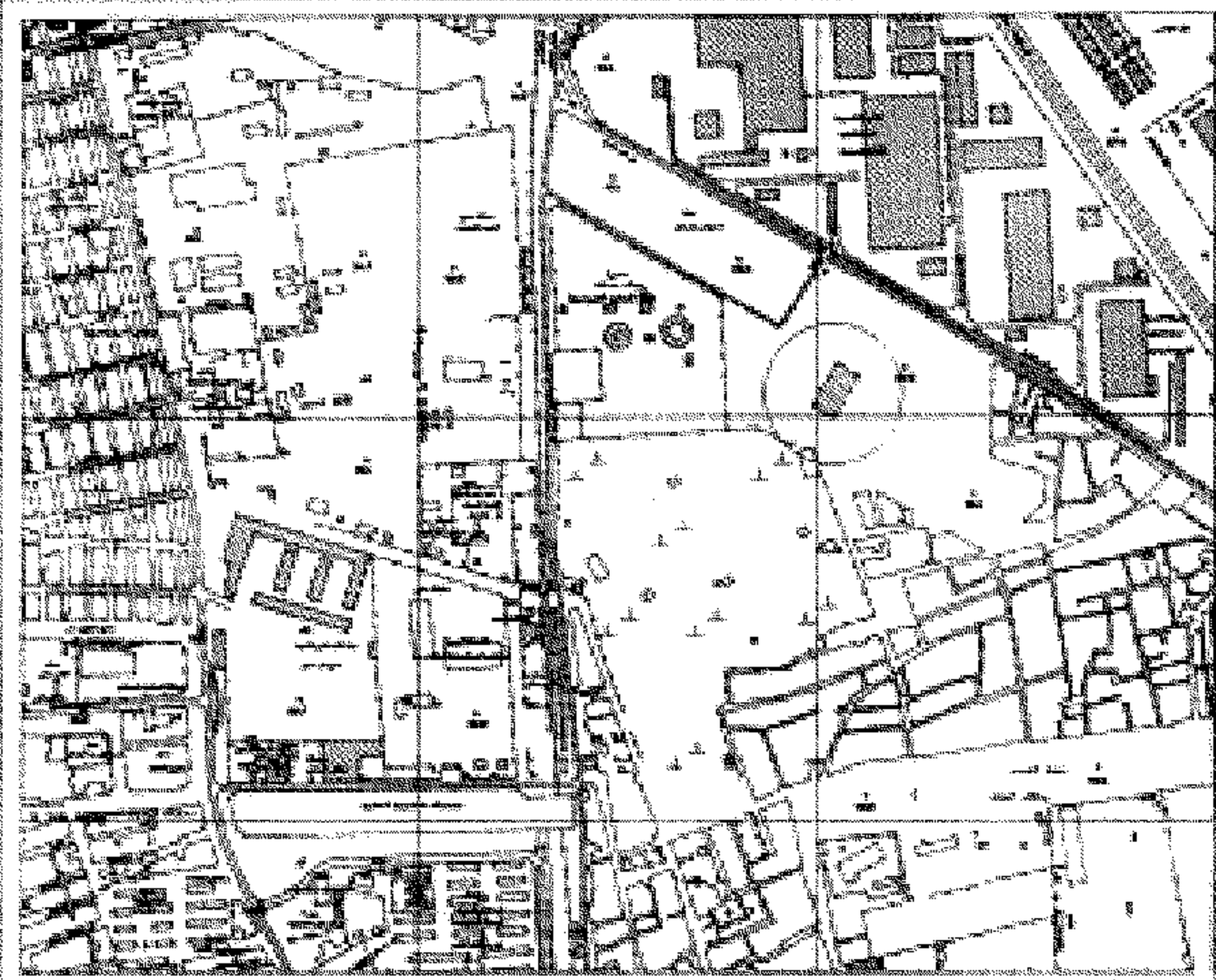
مزمع من الخريطة الصناعية رقم ١٧٢

الموقع العام لقطعة الأرض الكائنة بمقبرة الصر بين البساتين المطلوب تخصيصها لصالح مديرية الشؤون الصحية لإقامة مركز طبي عليها