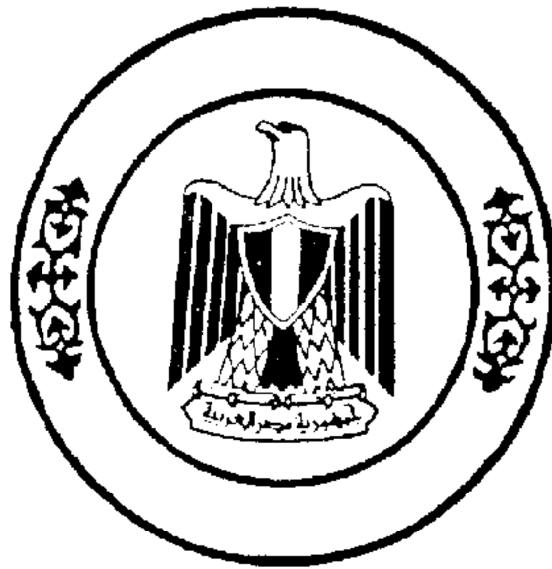
النموذج رقم (٢) خاتم جمهورية مصر العربية