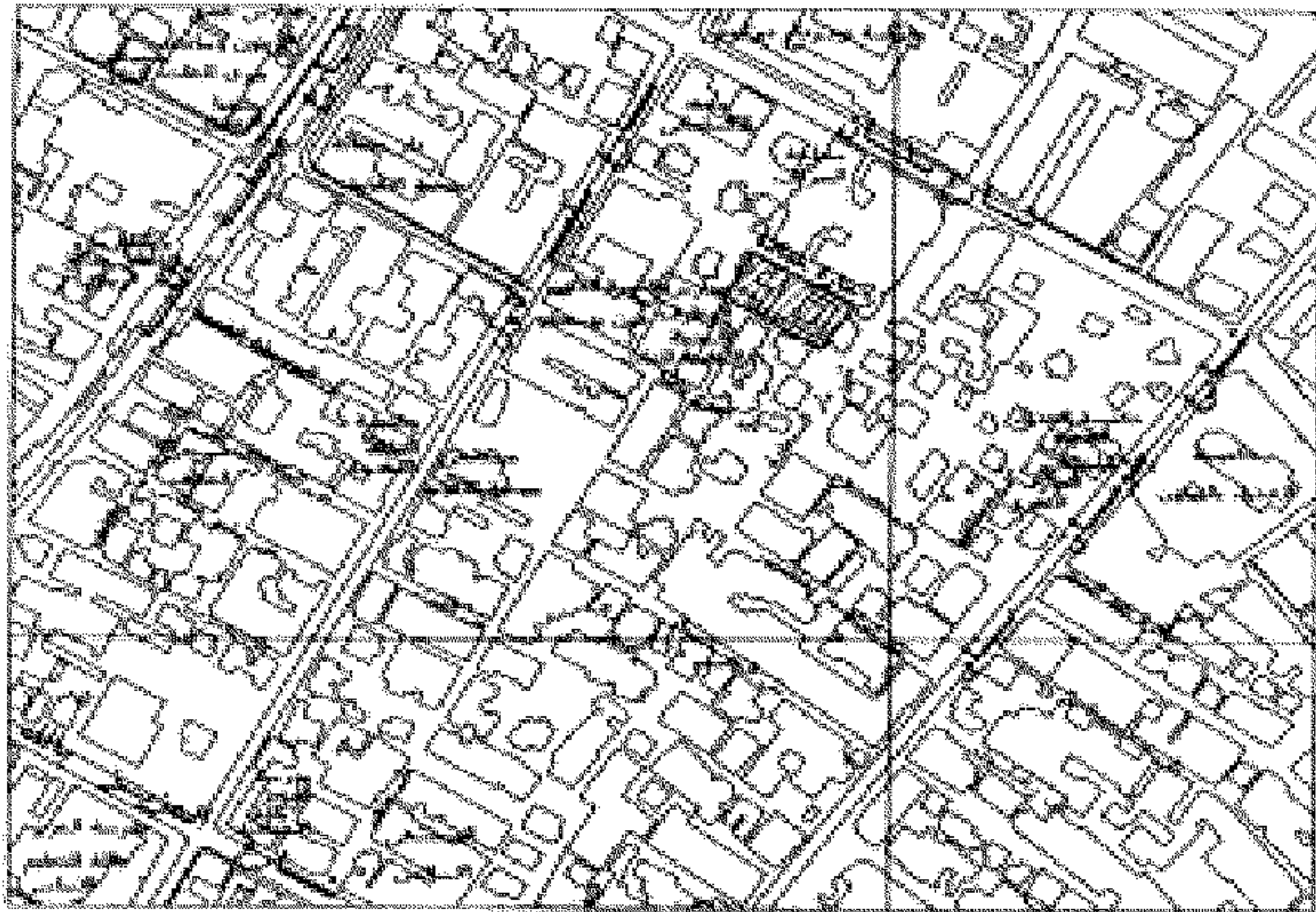
جزء من الخريطة العسكرية لـ ١٢

الموقع المقام للقطعة الأرض الكافية لتعاية حارة حسامة من شارع سليم الأول بقطاع حي الزيتون بمساحة ١٠٣٦,٦ م ٢ تقريبا العتاقيل عتقا بتون مقابل لاقامة مسجد ابن حكيم ملك الله والسلطان تشييدها لصالح وزارة الأوقاف